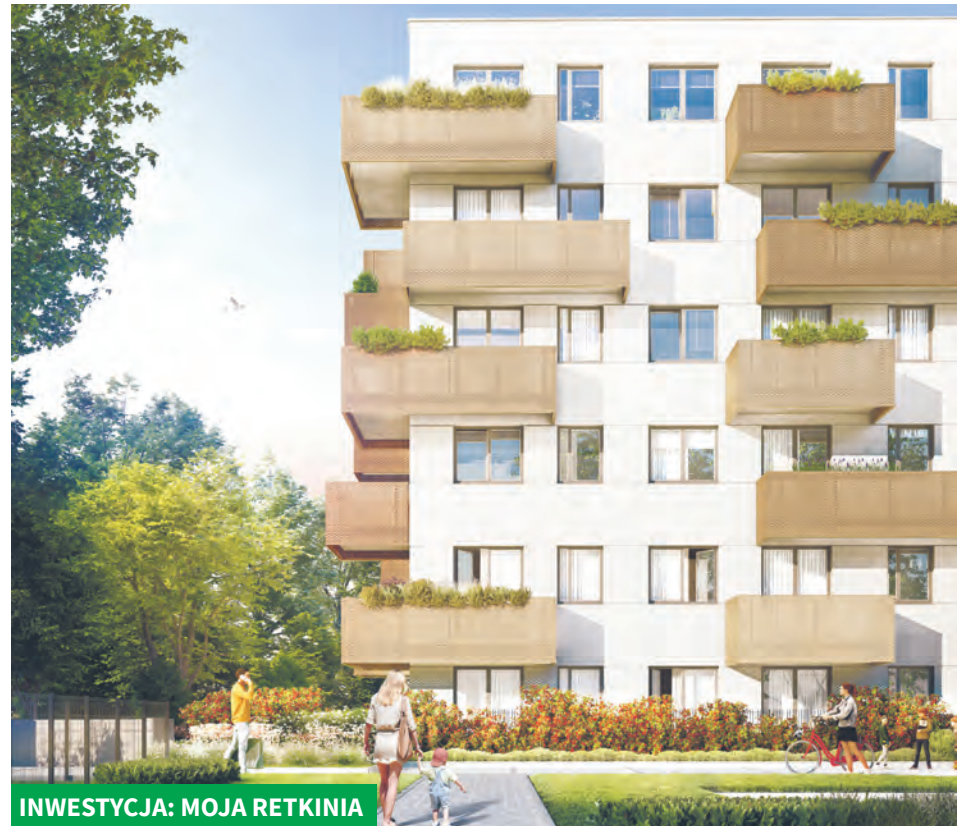
INWESTYCJA: MOJA RETKINIA

zań ekologicznych. Inwestycja wyposażona w pompy ciepła, panele fotowoltaiczne, stację ładowania samochodów elektrycznych, energooszczędne oświetlenie LED oraz bogatą zielen m.in. łąkę kwietną z hotelem dla owadów. Projekt przewiduje 2,3,4 – pokojowe apartamenty z prywatnymi ogródkami lub tarasami; reprezentacyjny hol wejściowy oraz cichobieżne windy. Nowe inwestycje propagują niskoemisyjne środki transportu: każde miejsce parkingowe będzie miało możliwość podpięcia do stacji ładowania samochodów elektrycznych. Ponadto na osiedlach nie zabraknie stojaków na rowery oraz stacji naprawy rowerów. W częściach wspólnych przewidziano energooszczędne oświetlenie LED z czujnikami ruchu; natomiast w nawiewnikach okiennych zastosowane będą filtry antysmogowe.