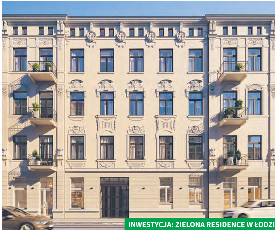
INWESTYCJA: ZIELONA RESIDENCE W ŁÓDZI