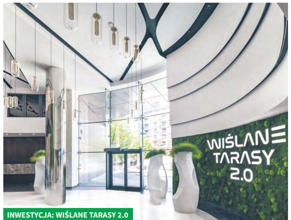
INWESTYCJA: WIŚLANE TARASY 2.0

Łączy ekonomię z ekologią i społeczną odpowiedzialnością, kreując wartość nie tylko dla swoich klientów, ale i dla oka mieszkańców siedmiu miast, w których działa.