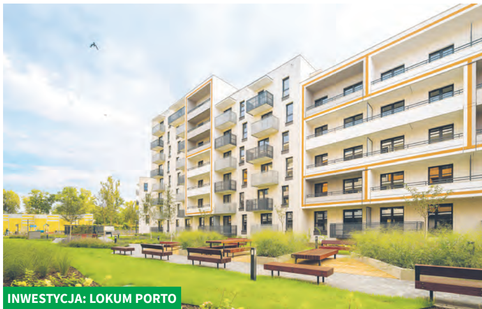
INWESTYCJA: LOKUM PORTO