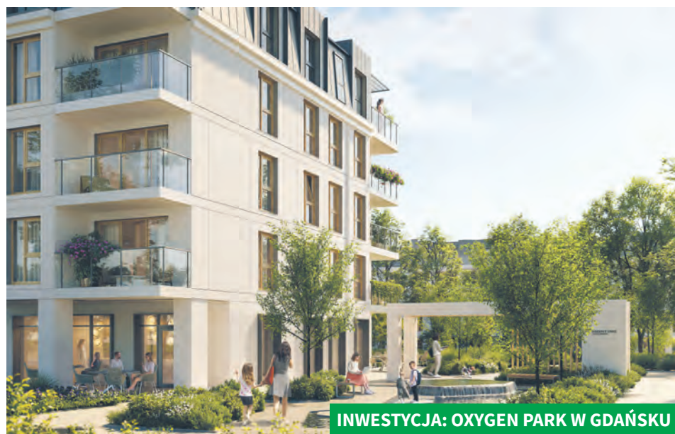
INWESTYCJA: OXYGEN PARK W GDAŃSKU

przestrzeni pod tereny zielone. Na terenie Oxygen Park zastosowano też ekologiczne rozwiązania w zakresie dostarczania energii. We wspólnej przestrzeni zastosowane zostaną energooszczędne oświetlenie LED z czujnikami ruchu. Wykorzystywane przez firmę wysokiej jakości materiały wykończeniowe powodują, że zmniejszą się straty ciepła. Wykorzystanie odpowiednich materiałów izolacyjnych przełoży się m.in. na niższe rachunki za energię elektryczną. Długoterminowa strategia spółki oparta jest na innowacyjnych, lecz sprawdzonych technologiach i ekologicznych rozwiązaniach. Zarząd firmy wierzy, że troska o środowisko to stały trend, a nie przejściowa moda.