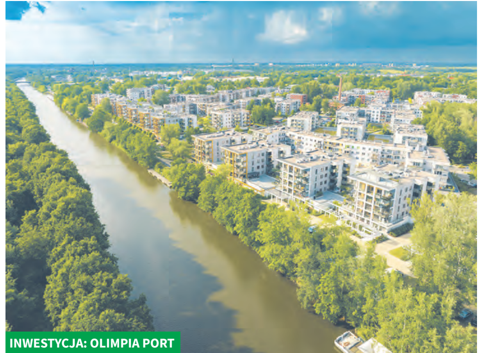
INWESTYCJA: OLIMPIA PORT

zamieszkiwania. Historia Archicom zaczęła się od studia projektowego, gdzie od początku żywa była idea dbałości o ludzki wymiar architektury, jej współistnienie z naturą i kontekstem miejsca. Deweloper rozumie swoją rolę jako urbanisty, inżyniera i wizjonera. Myśli szeroko, biorąc pełną odpowiedzialność za tworzenie fragmentów miast dla kolejnych pokoleń. Patrzy na miasto jak na żywą tkankę, która powinna dopasowywać się do współczesnych odbiorców. Cel jest niezmienny – dostarczać nowy standard mieszkania.