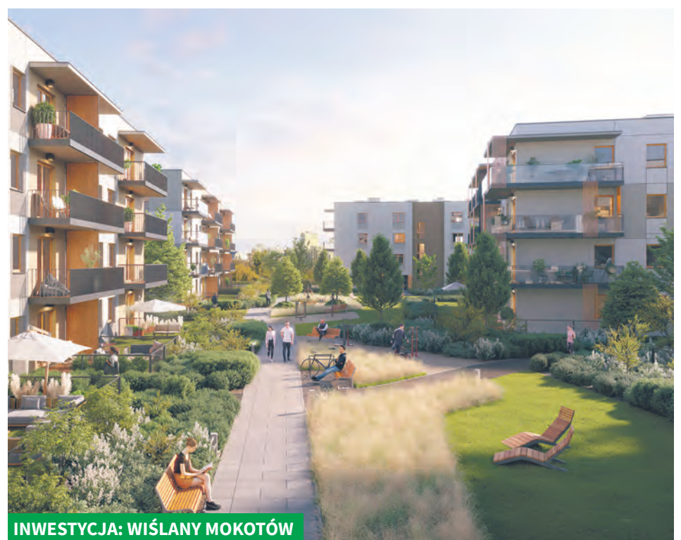
INWESTYCJA: WIŚLANY MOKOTÓW

(ESG). Spravia stawia na budowanie społeczności, rozwijanie relacji sąsiedzkich oraz tworzenie otoczenia przyjaznego wszystkim mieszkańcom. Firma rozumie i wspiera ludzkie potrzeby. Wsłuchuje się w głos wszystkich interesariuszy. Osiedle Wiślany Mokotów w Warszawie to doskonały przykład zrównoważonego projektu mieszkaniowego. Powstaje w zgodzie z aktualnymi trendami i polityką dostępności. Połączono w nim funkcjonalną architekturę z bogatą, nadwiśląską roślinnością, która na każdym etapie osiedla zachwyca, uatrakcyjnia otoczenie oraz poprawia komfort życia mieszkańców.