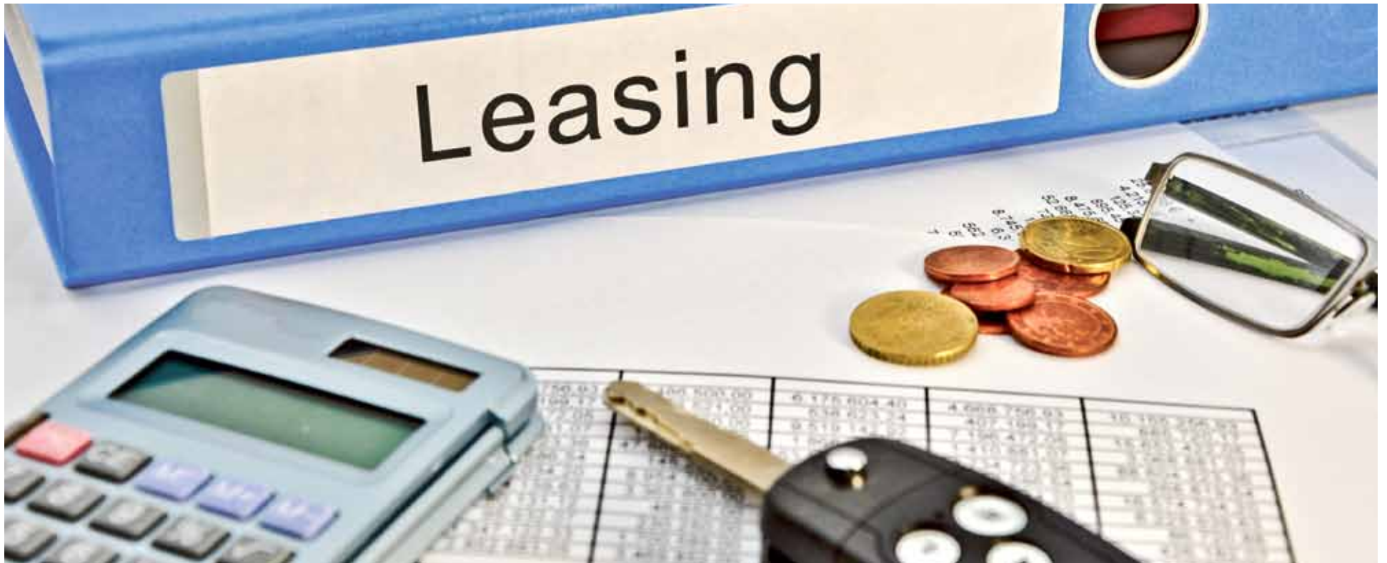
Wartość ogółem ruchomości i nieruchomości oddanych w leasing w 2017 r. (w tys zł)